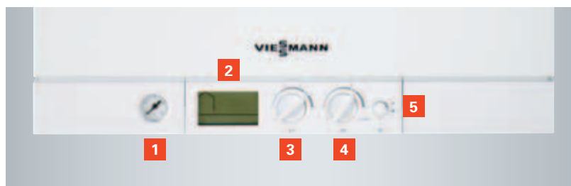
Regulácia s integrovaným diagnostickým systémom

U nabíjacieho zásobníka kontinuálne obieha voda vo výhrevných plochách prietokového ohrievača dosiahne želanú teplotu a je okamžite k dispozícii pri ďalšom odbere. Snímače teploty sa starajú o to, aby bola dosiahnutá požadovaná teplota. V prípade potreby sa u zariadenia Vitodens 111-W automaticky zapojí cylindrický horák MatriX a stará sa o želanú teplotu vody. Tento princíp sa využíva najmä pri naplnení vane alebo pri dlhom sprchovaní.