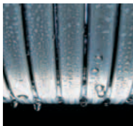
Výhrevná plocha Inox-Radial – dlhá životnosť a efektívnosť

Nástenný plynový kondenzačný kotel Vitodens 111-W s integrovaným nerezovým nabíjacím zásobníkom ponúka vysoký komfort vykurovania a teplej vody.